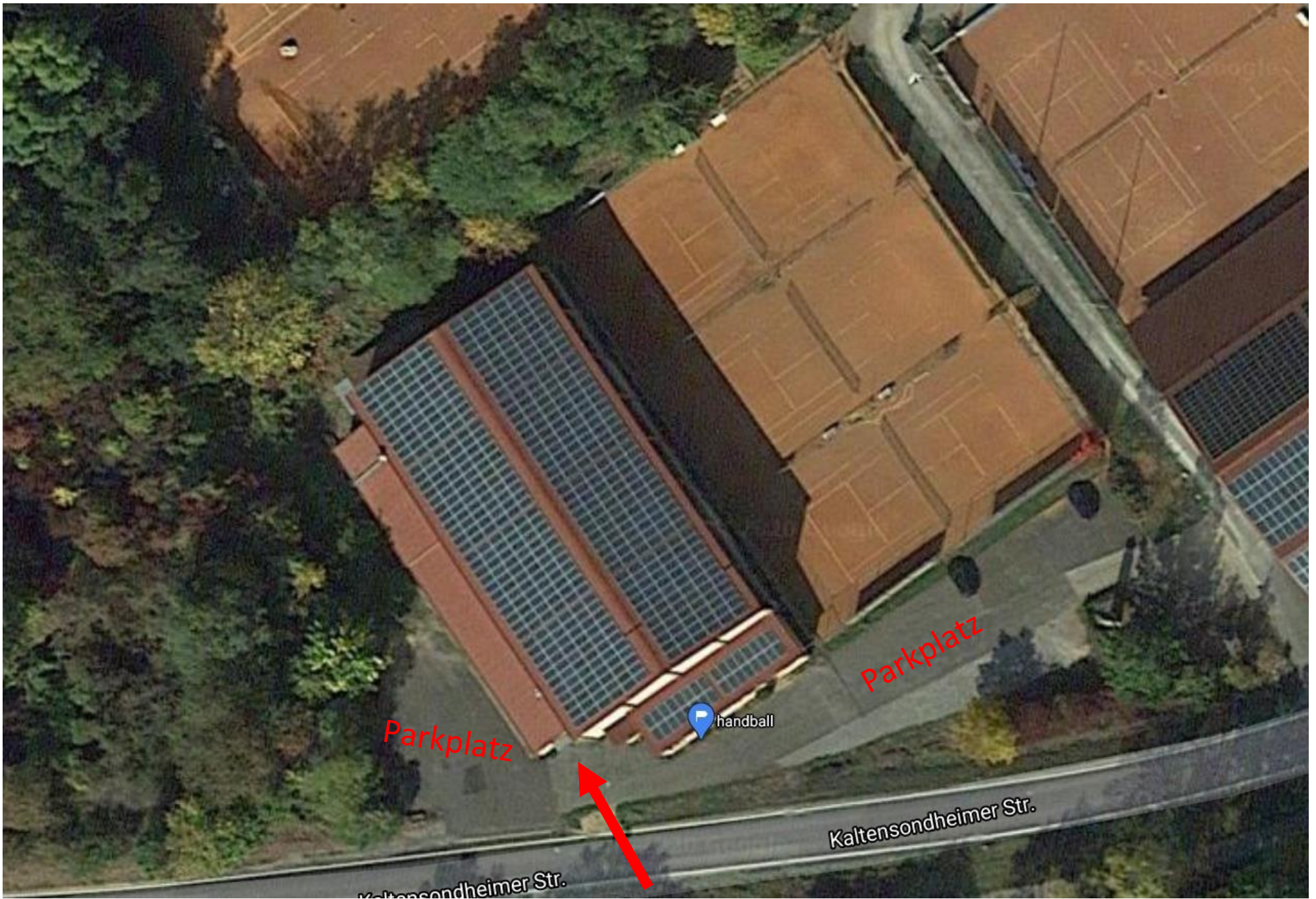
Eingang & Ausgang